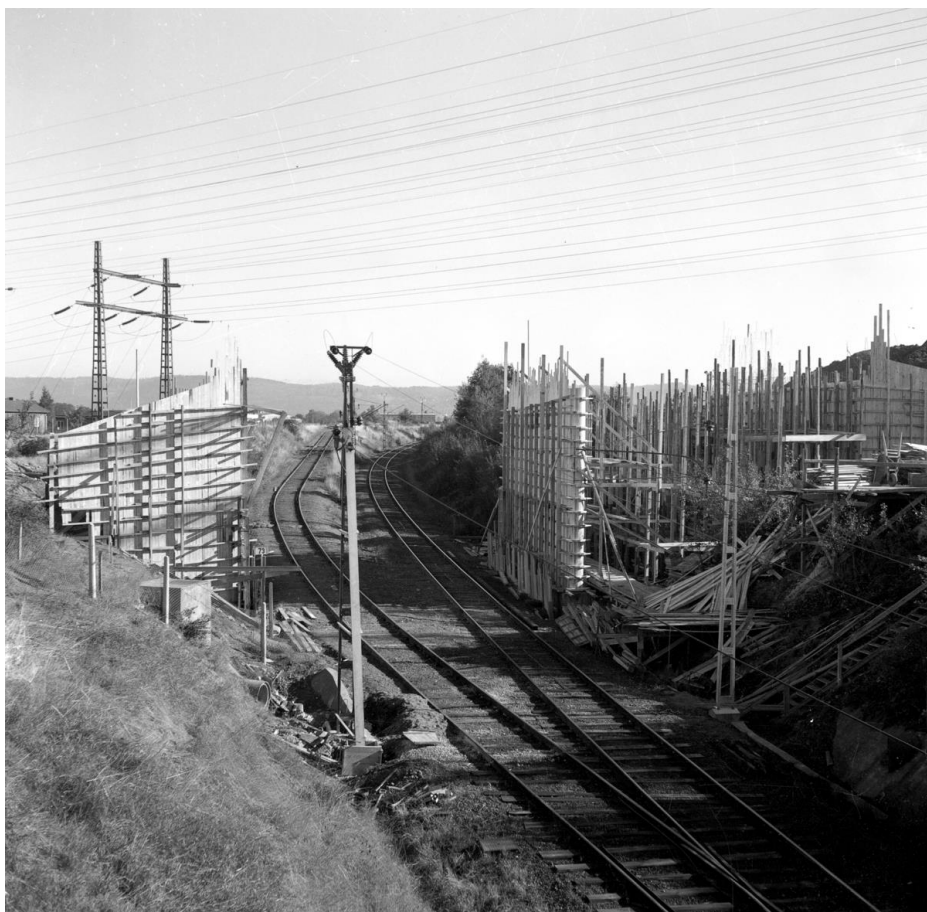
Jönköping 1959-1960. Järnvägsbro vid Ekhagsrondellen.