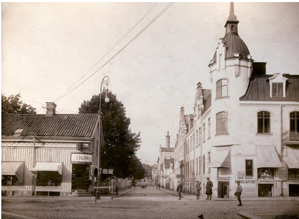
Bäckgatan - Storgatan i Växjö, ca. 1915. Cigarr-Olles och Feukska huset