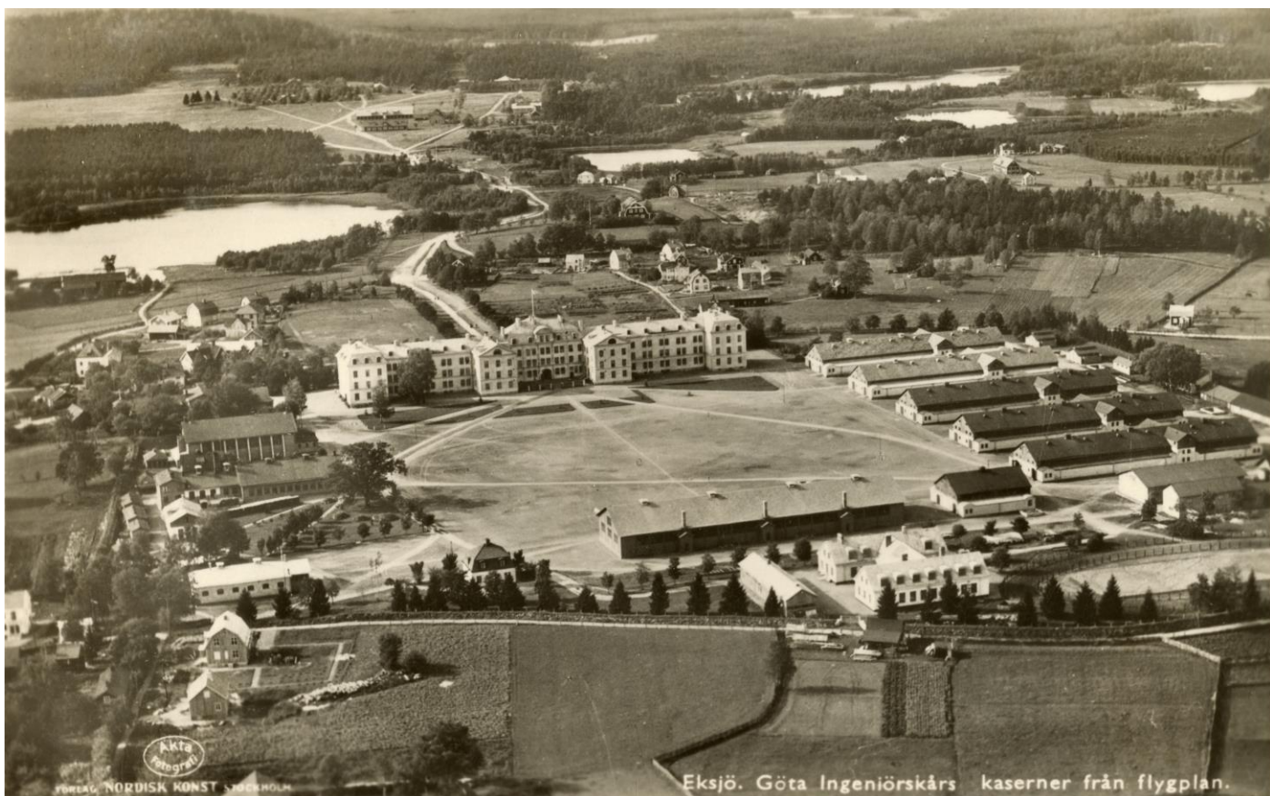
Eksjö, Ing2, 1928-1929