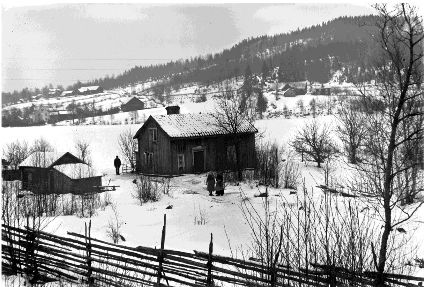
Sjölandet var ett torp under komministerbostället Drefseryd Norrgård i Ölmostad socken. På andra sidan sjön Bunn syns de fyra gårdarna i byn Fågelkärr i Haurida socken.