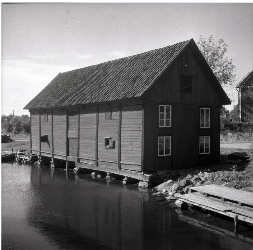
Misterhultsboden i Figeholm.