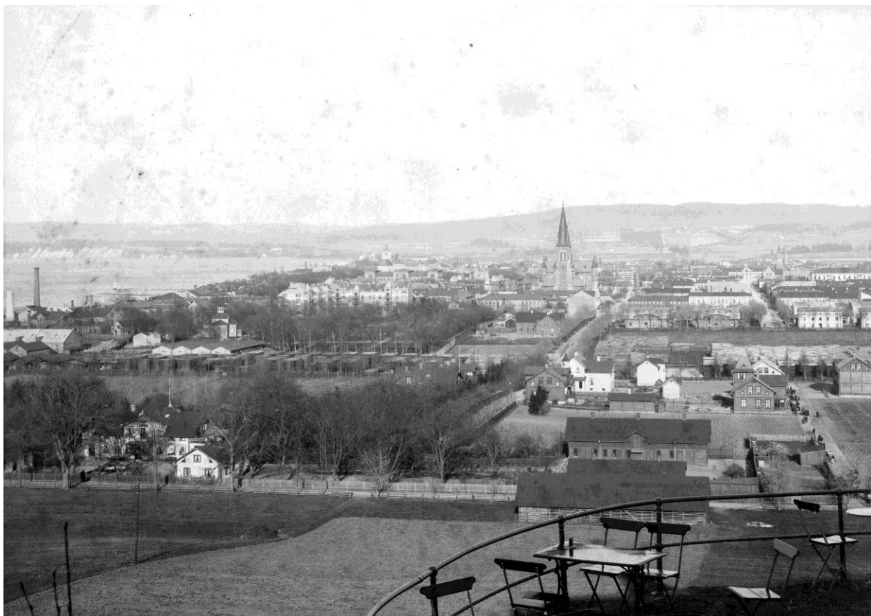
Jönköping från Stadsparken, ca 1900