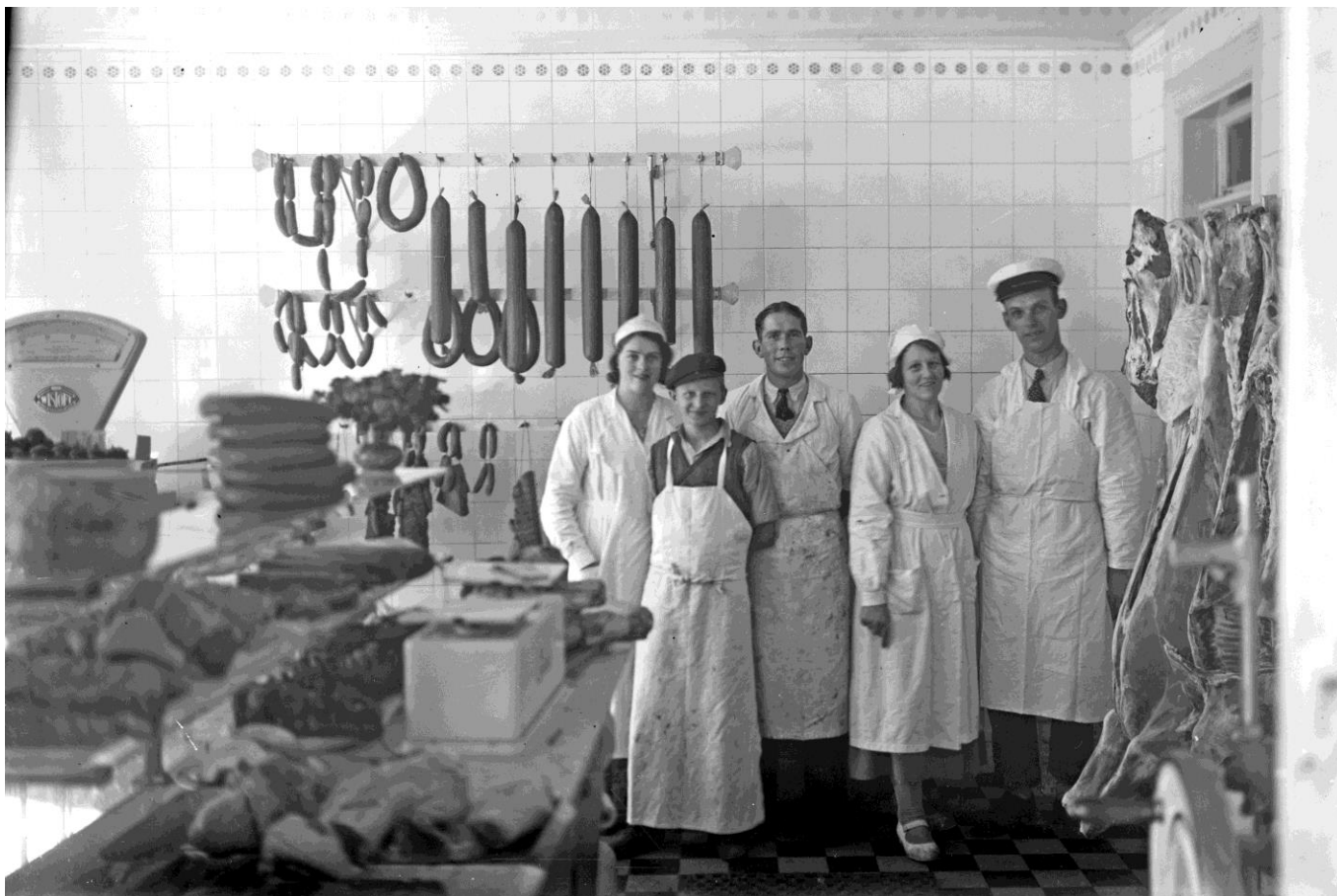
Personal vid Fogelbergs chark, Jönköping 1938