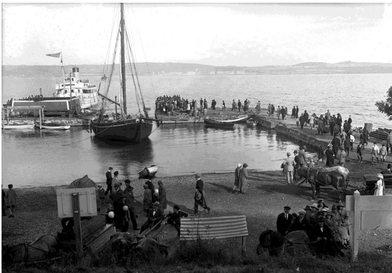
Ångaren Wisingsborg, 1920-1930