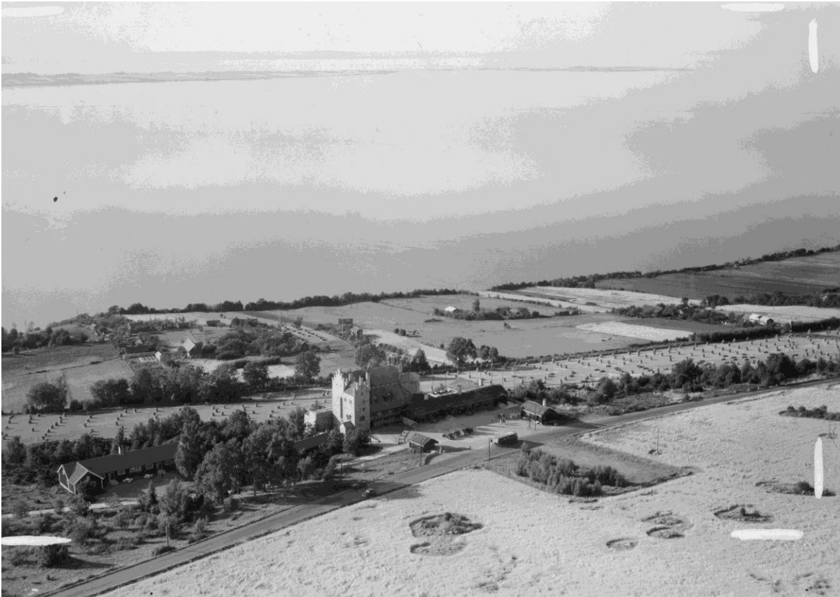
Gyllene Uttern 1946