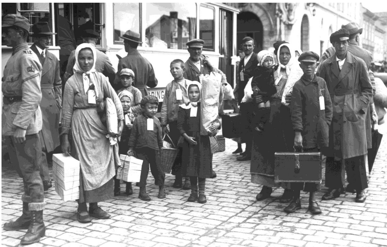
Svenskbybornas ankomst till Jönköping år 1929. Från tåget går färden vidare med spårvagn till I12:s gamla förläggningsslokaler på Ryhovsområdet.