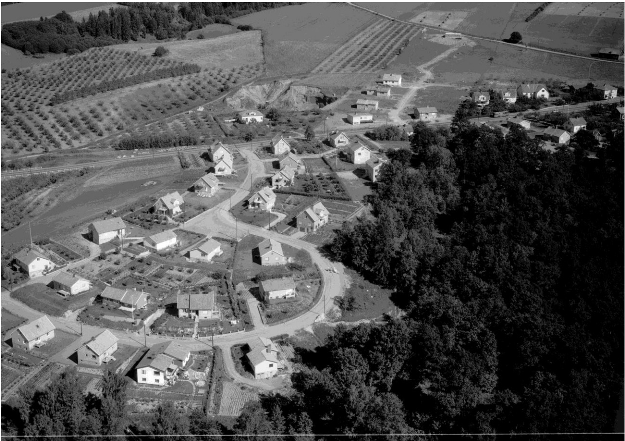
Kaxholmen, Skärstad 1959