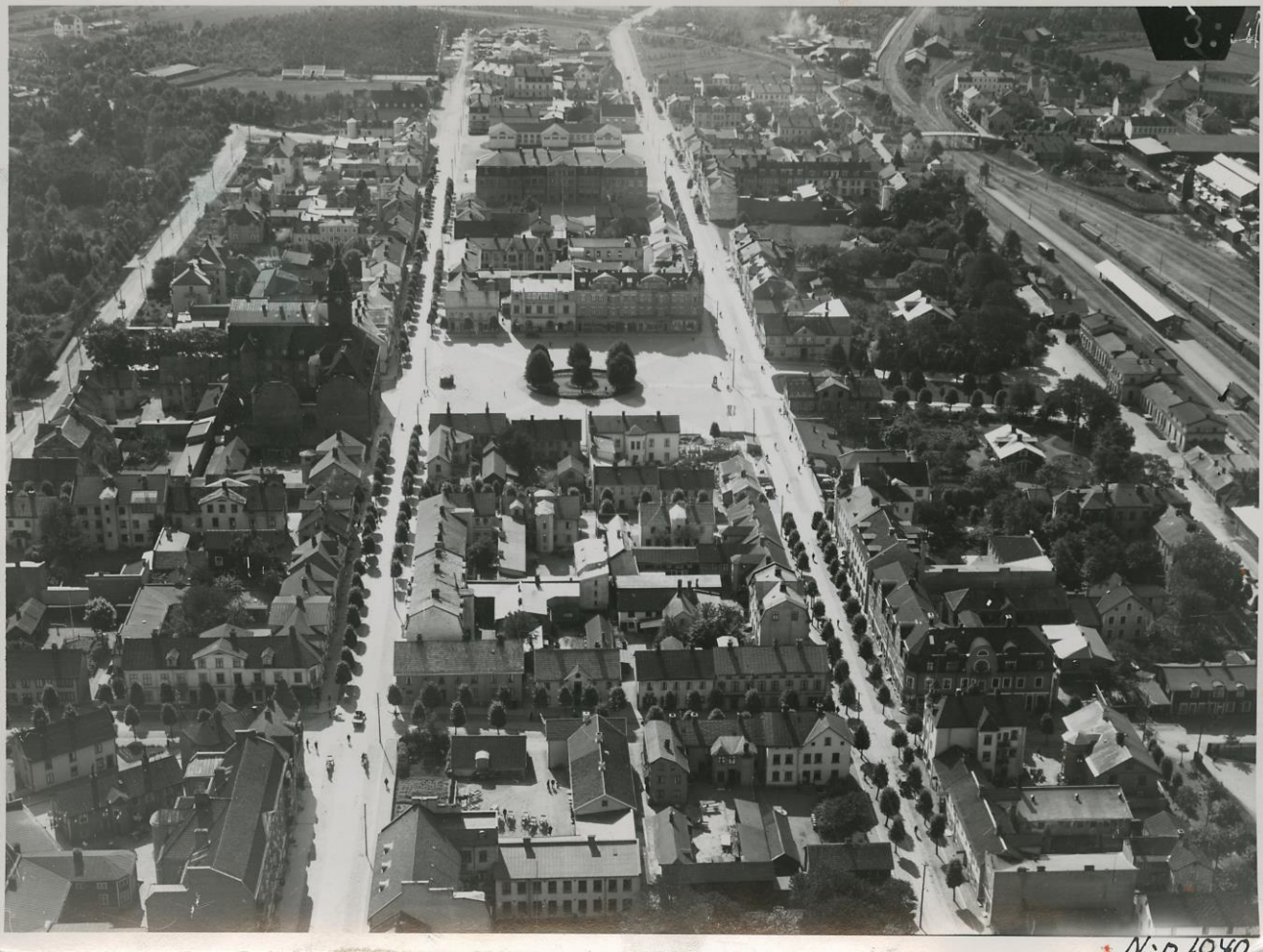
Nässjö, ca 1930