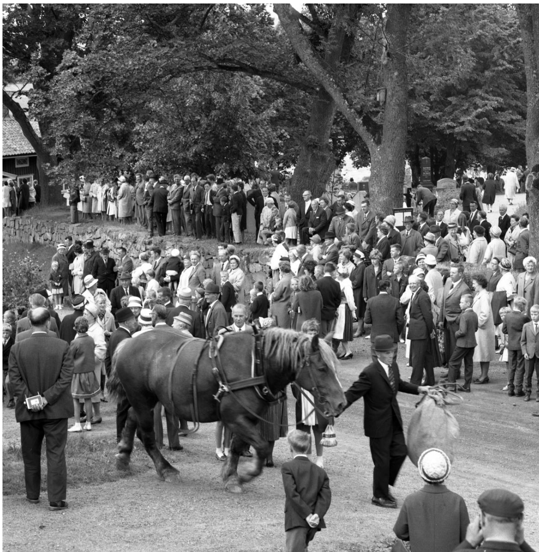
Hembyggsdag, Skärstad 1964