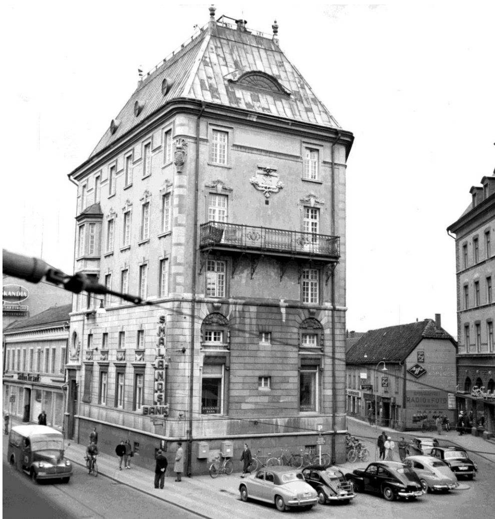
Smålandsbanken år 1957 vid Hoppets gränd (senare Hoppets torg) i Jönköping.