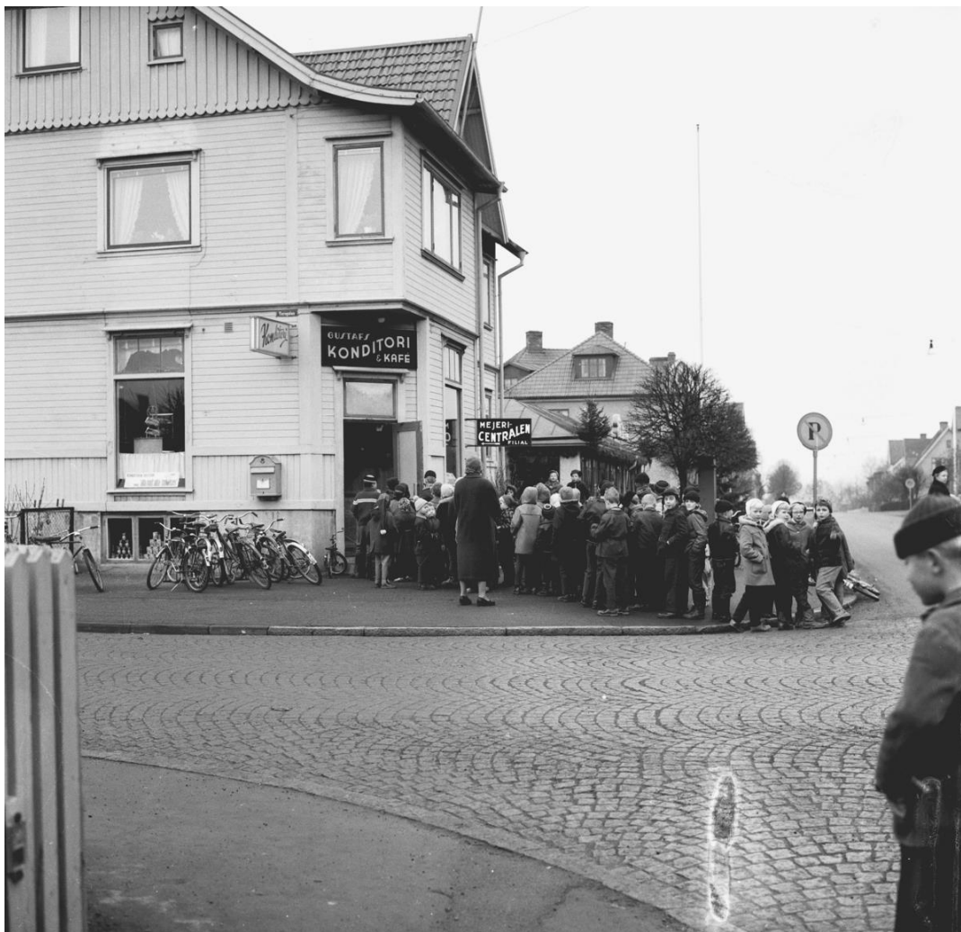
Kö till Gustavs konditori, Huskvarna 1957