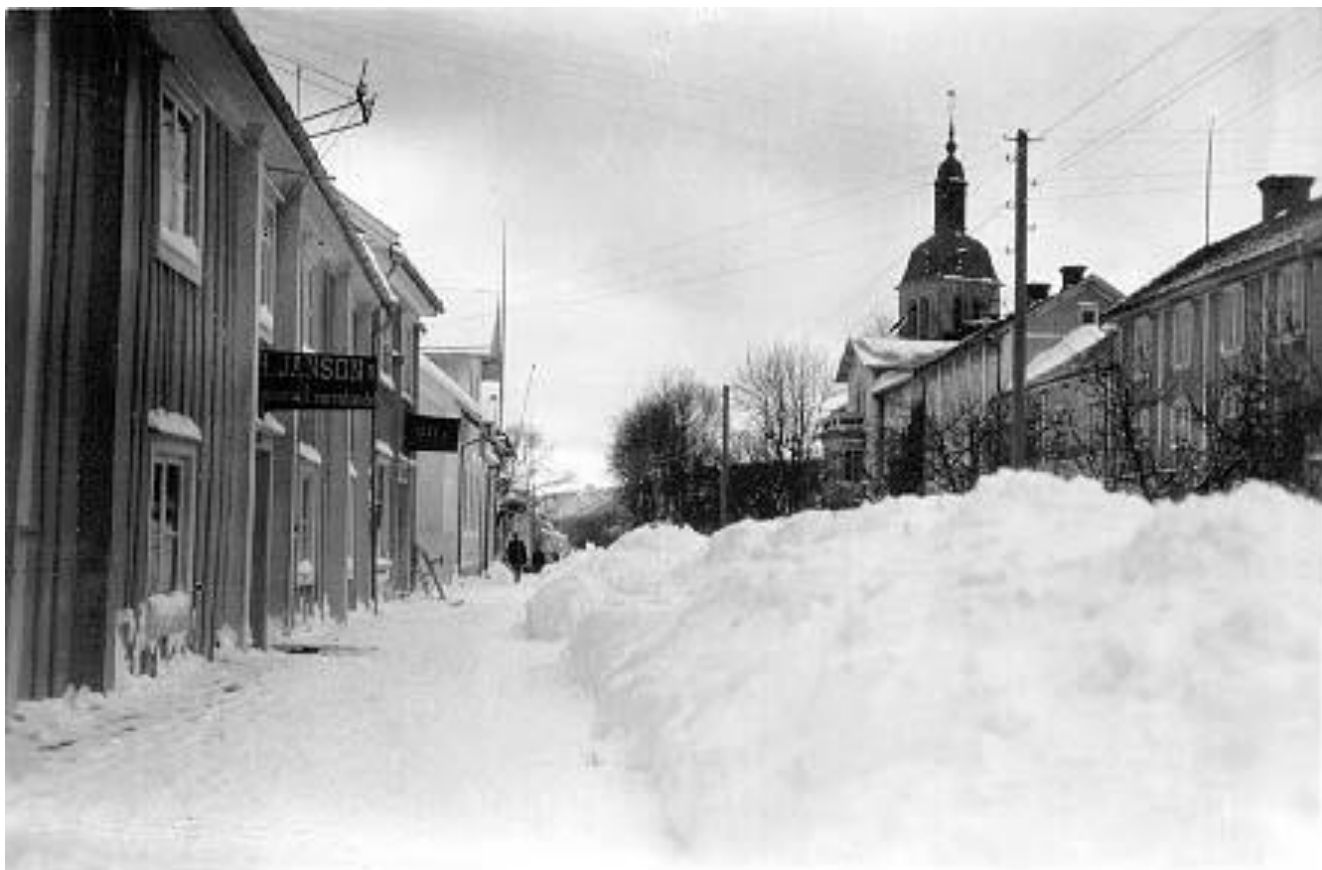
Grena vintern 1931