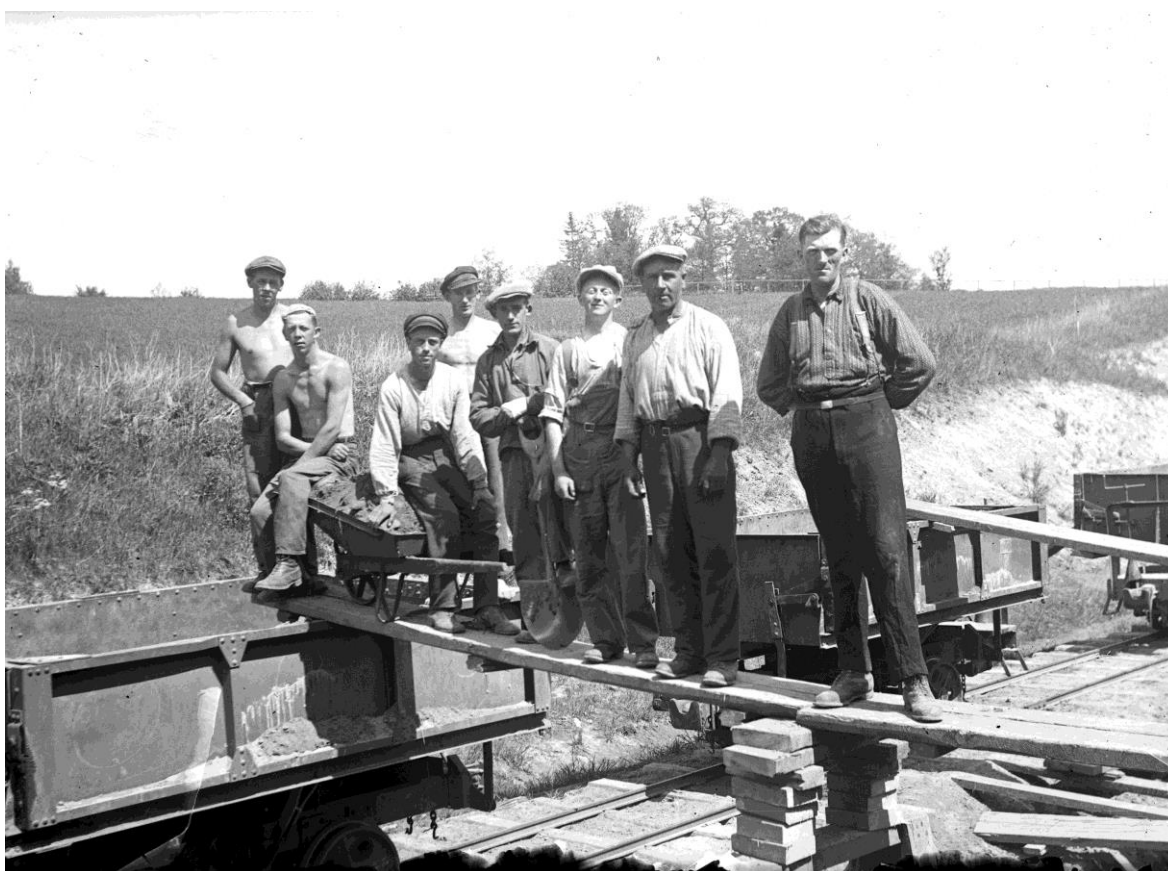
Byggandet av Jönköpings gamla flygfältet som låg på Ljungarumsområdet mellan Munksjön och Rocksjön och var i drift mellan 1935 och 1961 då det ersattes av Axamo flygplats, numera Jönköpings flygplats.