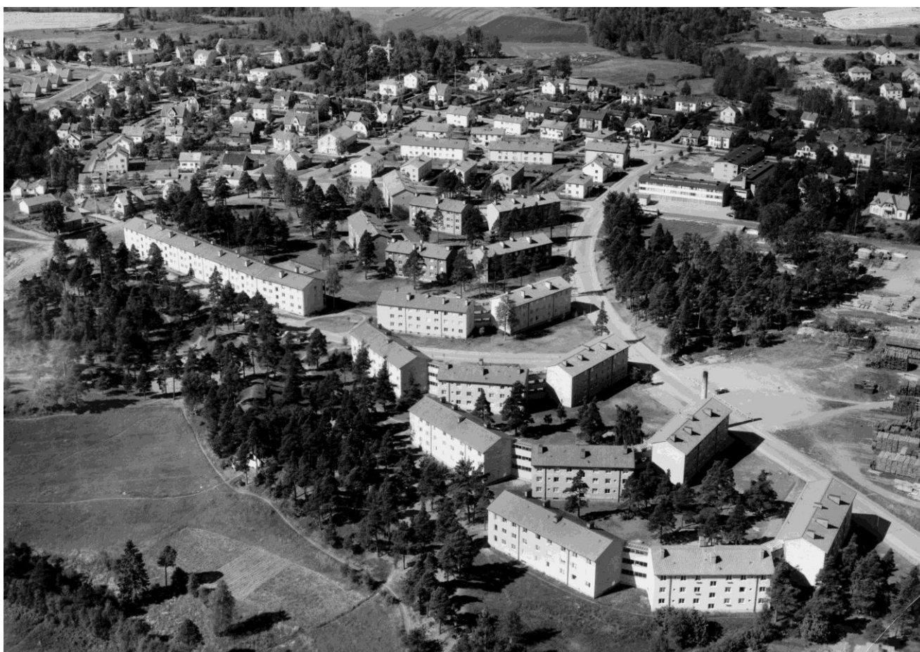
Tuvenhagen, Eksjö 1959