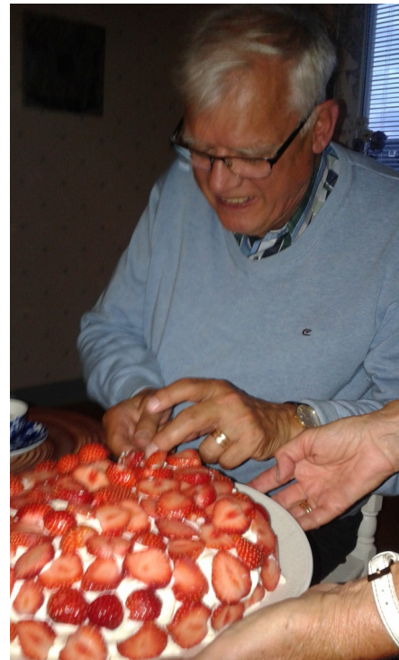
Åldermannen inmundigar födelsedagstårta